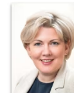
Laila Keimere Mikrouzņēmumu nodoklis