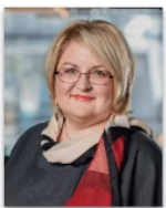
Vita Sakne Ievads Latvijas nodokļu sistēmā