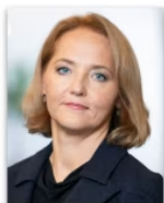
Kristīne Skrašiņa Pievienotās vērtības nodoklis