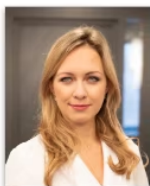
Viktorija Lavrova Nodokļi fiziskās personas ienākumiem | Uzņēmumu ienākuma nodoklis