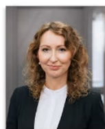
Zane Korņenkova Uzņēmumu ienākuma nodoklis