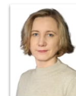
Jolanta Krastiņa Akcīzes nodoklis Muitas nodoklis